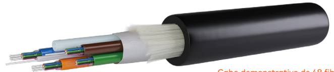
Cabo demonstrativo de 48 fibras